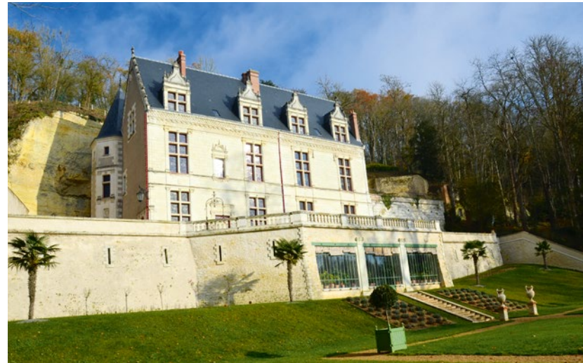
Das Château Gaillard bei Amboise kann erst seit Kurzem wieder besichtigt werden

genbäume in Frankreich akklimatisierte. Hierfür nutzte er die Orangerie unter dem Schloss, die in den Fels gebaut ist, und in der die Temperaturen das Jahr über nicht unter 14 Grad Celsius fallen. Nach der Restaurierung durch den Eigentümer erstrahlt das Schloss samt Gartenparadies wieder in neuem Glanz. Ganz auf den Anbau von Zitrusfrüchten wie Orangen und Zitronen fokussiert, lassen sich heute die Orangerie, einige Teile des Schlosses und vor allem die Gärten besichtigen. Der Eigentümer des Schlosses übernimmt die Führungen gerne selbst und erzählt in einzigartiger Weise von der Wiederentdeckung, der Restaurierung und der Geschichte des Schlosses. Sollten Besucher nicht ohnehin schon von dem Schloss begeistert sein, sind sie es zumindest von dem Herren. Vor Ort gibt es außerdem eine Zitrus-