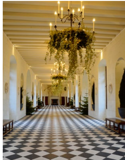
... und lange Galerien in den Schlössern