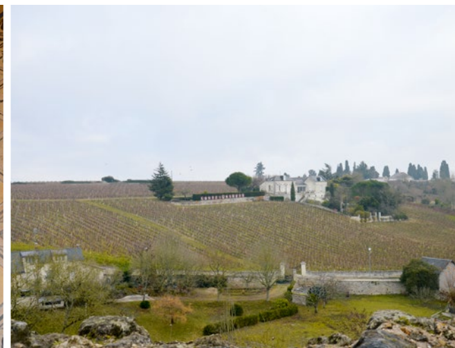
Die typischen Spezialitäten des Loiretals schmecken hervorragend