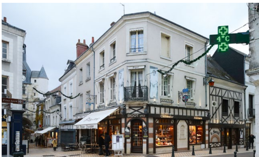
Kleine Boutiquen, Caféhäuser und Chocolatieren laden Besucher an jeder Ecke ein