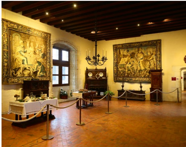
Königliche Festtafeln, kunstvolle Möbelstücke, Wandteppiche ...