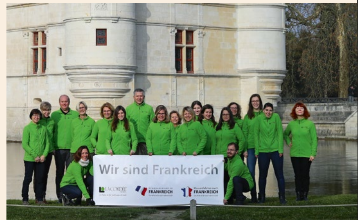
Das Team von La Cordée Reisen mit grünem Wiedererkennungsmerkmal

Mit regelmäßig stattfindenden Inforeisen hält sich das Team auf dem Laufenden, damit die Reisen in die verschiedensten Regionen von Frankreich immer auf dem aktuellsten Stand der Dinge durchgeführt werden können.